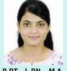
B.P.T. , L.P.N. , M.A.