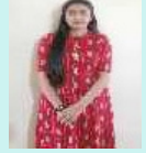
Bachelor of Pharmacy