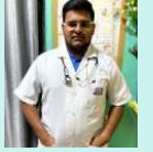
B. H. M. S.(Running)